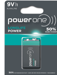
Bateria POWERONE LONGLIFE POWER 9V Blister 1u