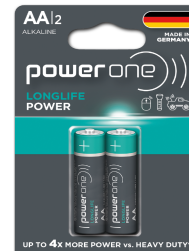
Bateria POWERONE LONGLIFE POWER AA Blister 2u