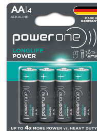
Bateria POWERONE LONGLIFE POWER AA Blister 4u